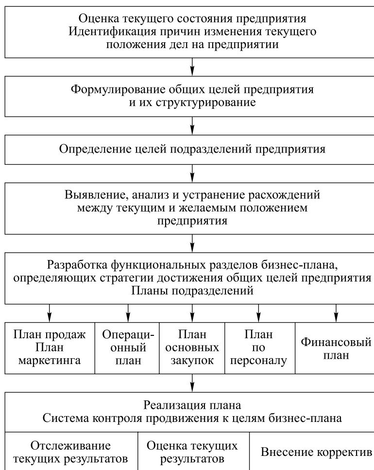
Рис. 2. Общий алгоритм разработки и реализации управленческого бизнес-плана

На основе общей цели (или целей) предприятия определяются частные цели структурных подразделений, которые конкретизируют их задачи. Основным моментом здесь является смещение внимания с автономно работающего подразделения на понимание общей цели предприятия. На малых (средних) предприятиях это достигается гораздо легче, чем на крупных.